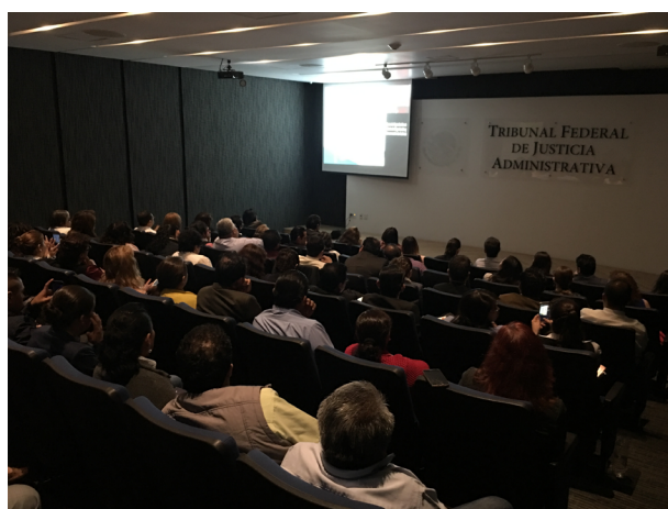
Público asistente al Curso de Capacitación en Materia de Organización y Conservación de Archivos, llevado a cabo en las sedes del TFJA.