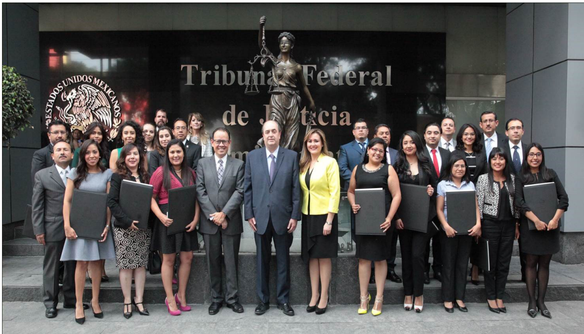
Foto generacional de los nuevos Especialistas en Justicia Administrativa, impartida en el Tribunal Federal de Justicia Administrativa, en la Ciudad de México.