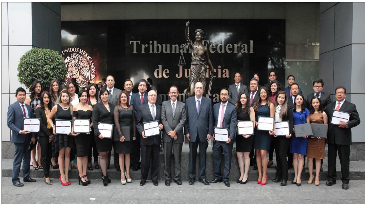
Foto generacional de los egresados de la Maestría en Justicia Administrativa, impartida en el Tribunal Federal de Justicia Administrativa, en la Ciudad de México.